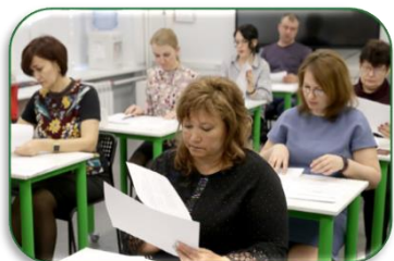
Родители и социум