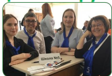
Педагоги и другие сотрудники ОО